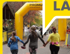
Demi-marathon des couleurs Promutuel

+ de 151 000 $ remis en dons et en commandites en 2024